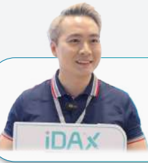
BS. CO THAO

"Triển lãm hôm nay rất chuyên nghiệp và quy mô, mang đến cho tôi nhiều kiến thức hữu ích về công nghệ chăm sóc da hiện đại, đặc biệt là các giải pháp nâng cao không xâm lấn. Tôi cũng có cơ hội tìm hiểu thêm nhiều sản phẩm chăm sóc da phù hợp với nhu cầu. Một trải nghiệm thật sự bổ ích và đáng giá!"